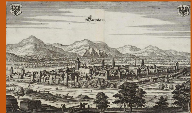
(Merian 1645: Landau in der Pfalz)