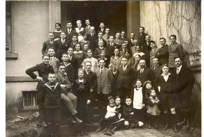
(Heimvolkshochschule Diemerstein 1926; 2. Jahrgang der Bauernvolkshochschule)